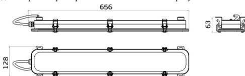
Рисунок 1 Светильник «L-sub 45»

1.5 Общий вид и габаритные размеры светильника показаны на рисунке 1.