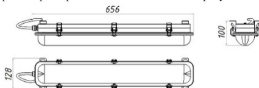
Рисунок 1 Светильник «L-sub 45»

1.5 Общий вид и габаритные размеры светильника показаны на рисунке 1.