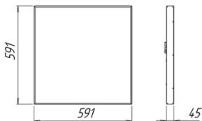
Рисунок 1 Светильник «L-office 55 Premium»